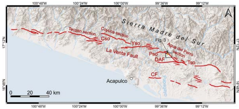
Figura 5. Principales secciones de la falla estudiadas

*Las líneas rojas muestran los diferentes segmentos que conforman la falla. El recuadro azul indica la ubicación de la sección Agua del Perro, donde se excavó la trinchera estudiada.