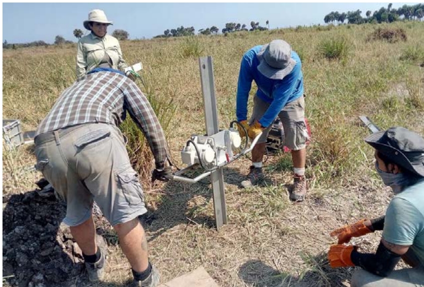
Figura 2. Proceso de extracción de muestras de sedimentos

*El equipo conocido como geoslicer permite recuperar parte del registro geológico con profundidades de dos metros o más, según lo permitan las condiciones.