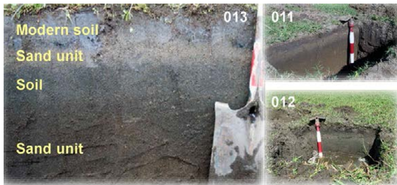
Figura 4. Fotografías de la estratigrafía de diferentes pits en la llanura costera de Corralero (Oaxaca)

*En las imágenes se observan dos unidades de arena separadas por suelos modernos, los contactos entre ellas son abruptos, lo cual evidencia depósitos de tsunami.